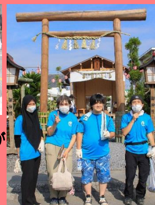
あいホーム石岡の利用者様が クリーンアップ作戦に 参加しました！